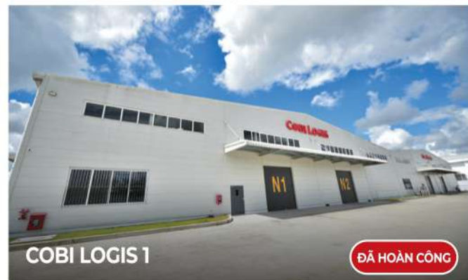
COBI LOGIS 1