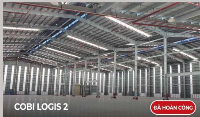
COBI LOGIS 2