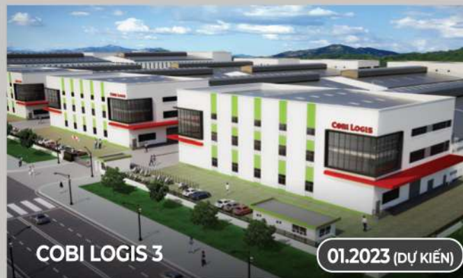
COBI LOGIS 3