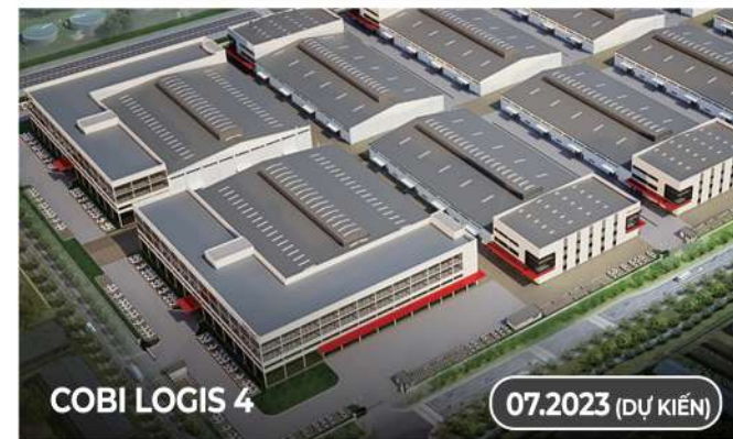
COBI LOGIS 4

"COBI LOGIS 4 XÂY DỰNG THEO YÊU CẦU CỦA KHÁCH HÀNG"